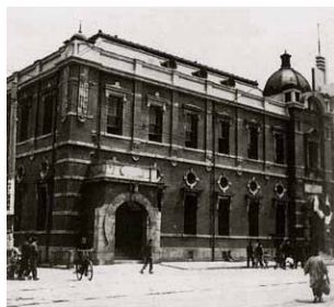
戦災復旧工事後の大分合同銀行(当時)本館