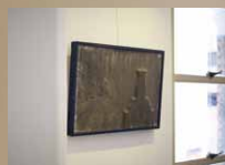
画廊内に展示された風倉作品

大分出身の吉村益信を中心に、1960年東京で結成された前衛芸術グループ「ネオ・ダダイズム・オルガナイザーズ」。彼ら「ネオダダ」は過激なアクション、廃物など卑俗なオブジェの使用、即興的パフォーマンスなどを通して60年代美術シーンをリードし、その後の日本美術界に大きな影響を与えた。「ネオダダ」メンバーの風倉匠の作品を中心に、当時の活動と現代とを重ね合わせようとする展覧会だ。