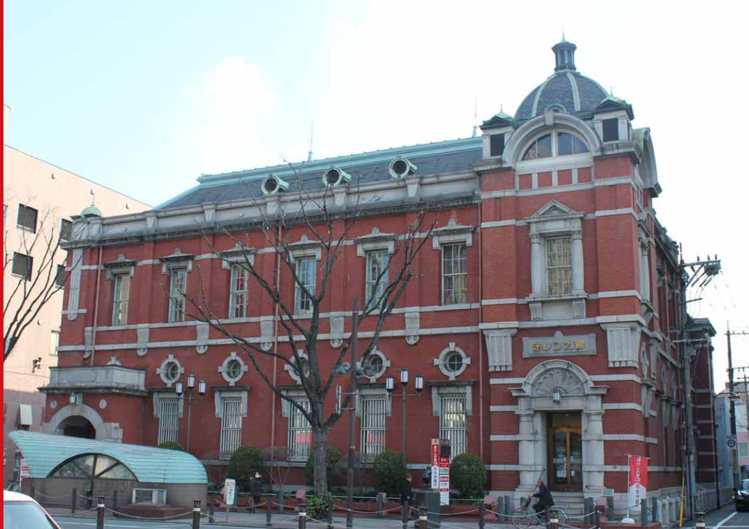
1996(平成8)年、国の登録有形文化財に指定された大分銀行赤レンガ館(1996年撮影)

昨年、開業100周年を迎えた東京駅。この日本を代表する近代建築を設計した辰野金吾による建物が、大分市内にもある。それが、大分銀行赤レンガ館(旧第二十三国立銀行本店II写真上)だ。輸入赤煉瓦に白い御影石の帯を巡らせ、ドームを配したいわゆる「辰野式」。地元の建設会社が工事を担当し、1913(大正2)年に竣工した。第二次世界大戦末期には空襲で壁のみを残して焼失したものの、1949(昭和24)年、外部はほぼ以前のまま、内部も元の状態に近づける形で復旧された。そこにはこの素晴らしい建物を愛する大分市民