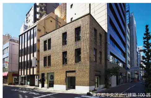
東京都中央区近代建築100選